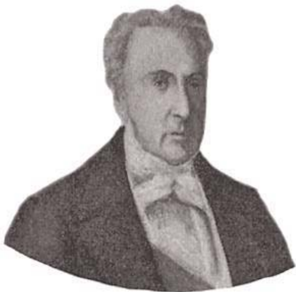
Marquês de Paranaguá