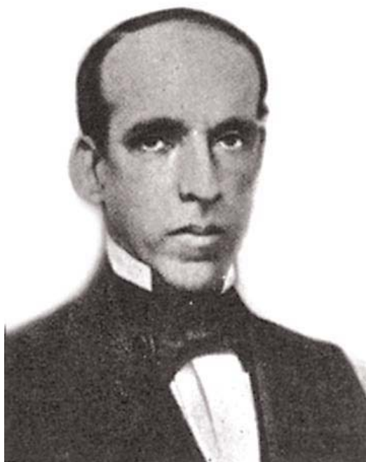
Zacarias de Góis e Vasconcelos