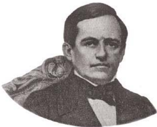
Barão de Muritiba