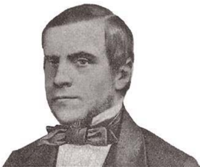
Marquês do Paraná