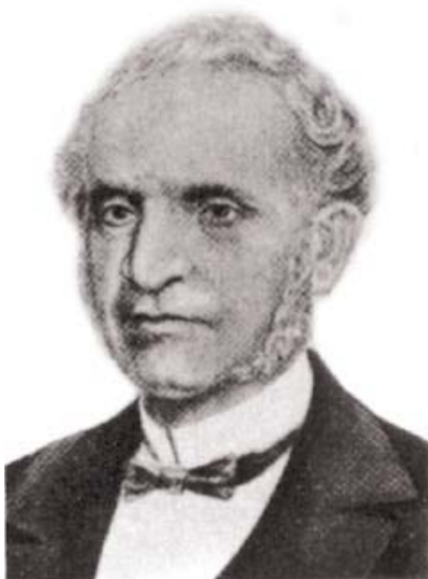
Barão de Cotegipe