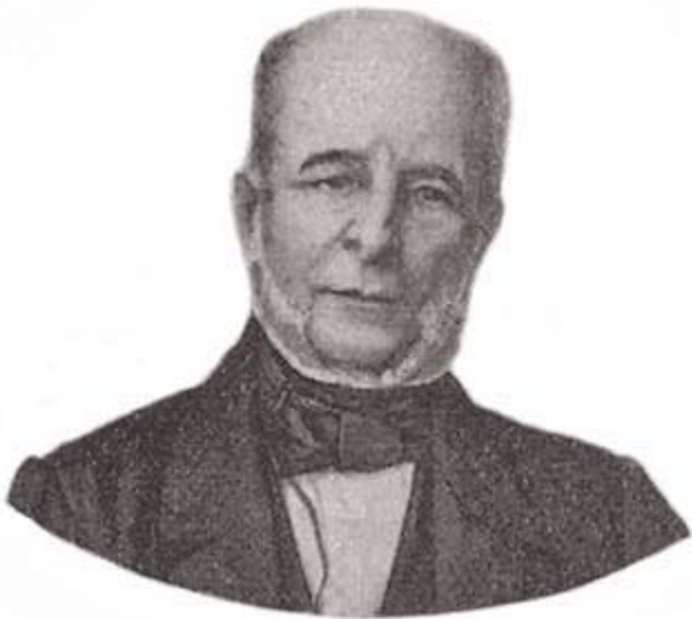
Marquês de Monte Alegre