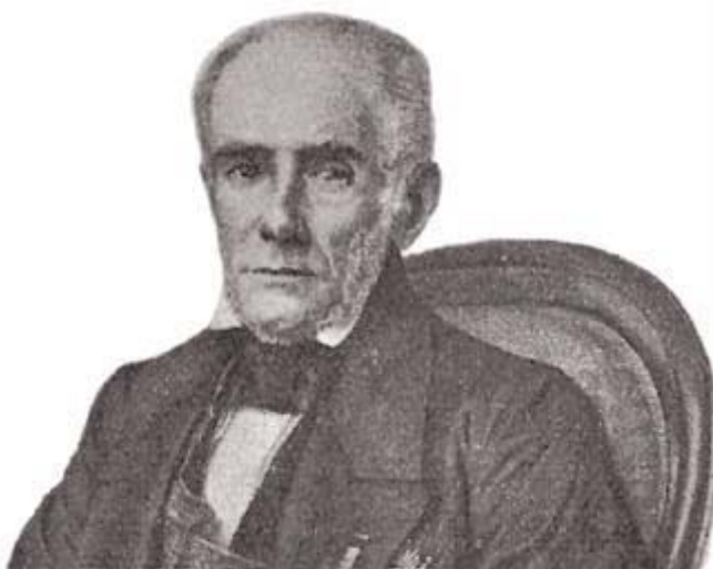
Marquês de Olinda