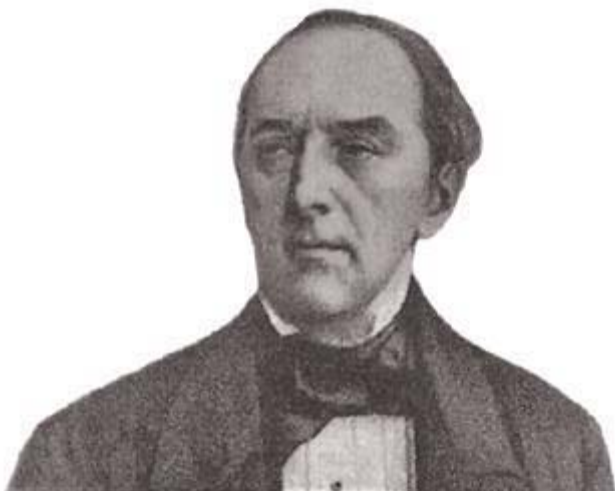
Visconde do Uruguai