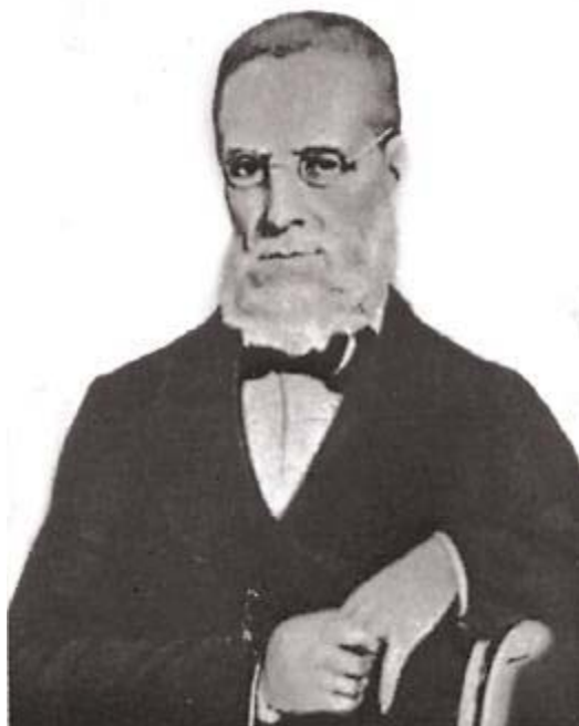
Marquês de Sapucaí