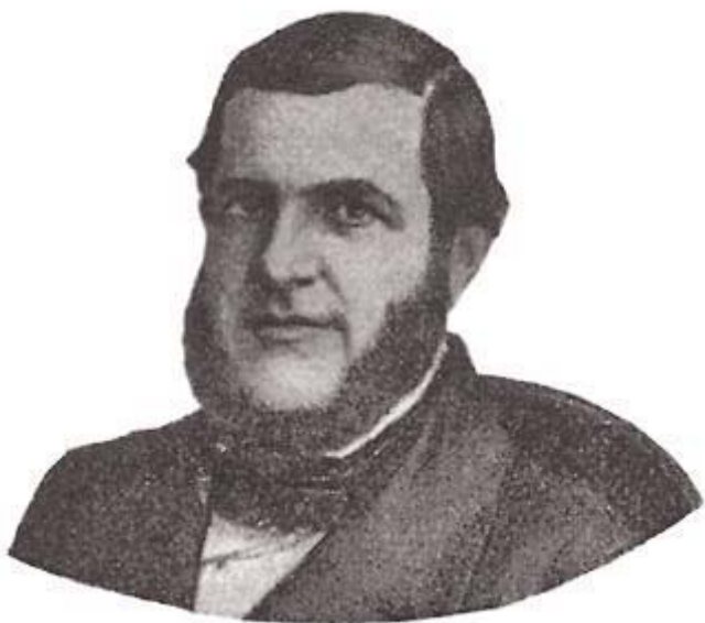
Eusébio de Queirós