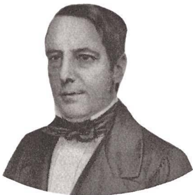
Nabuco de Araújo