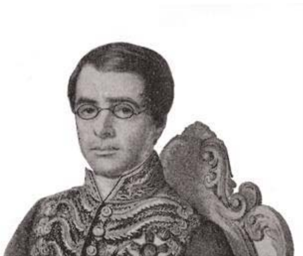
Visconde de Itaboraí