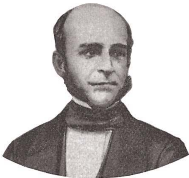
Visconde do Rio Branco