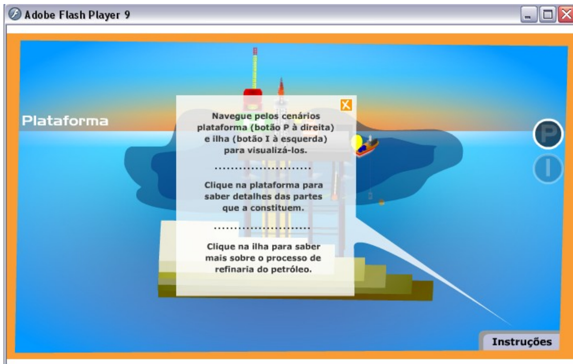
Figura 3: Caso o usuário tenha alguma dúvida ao manipular o objeto, clique com o botão esquerdo do mouse na opção “instruções” que aparecerá uma breve ajuda, clique novamente para fechar.