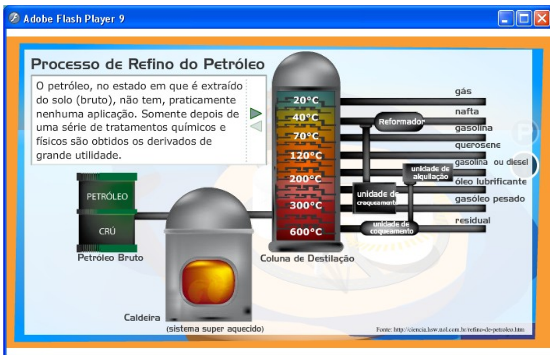
Figura 6: O processo de destilação fracionada realizado na refinaria pode ser explicado em maiores detalhes ao clicar nela com o botão esquerdo do mouse.