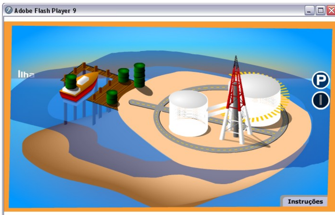
Figura 5: Clicando no ícone “I”, o objeto dá destaque a ilha onde se encontra a nossa refinaria.