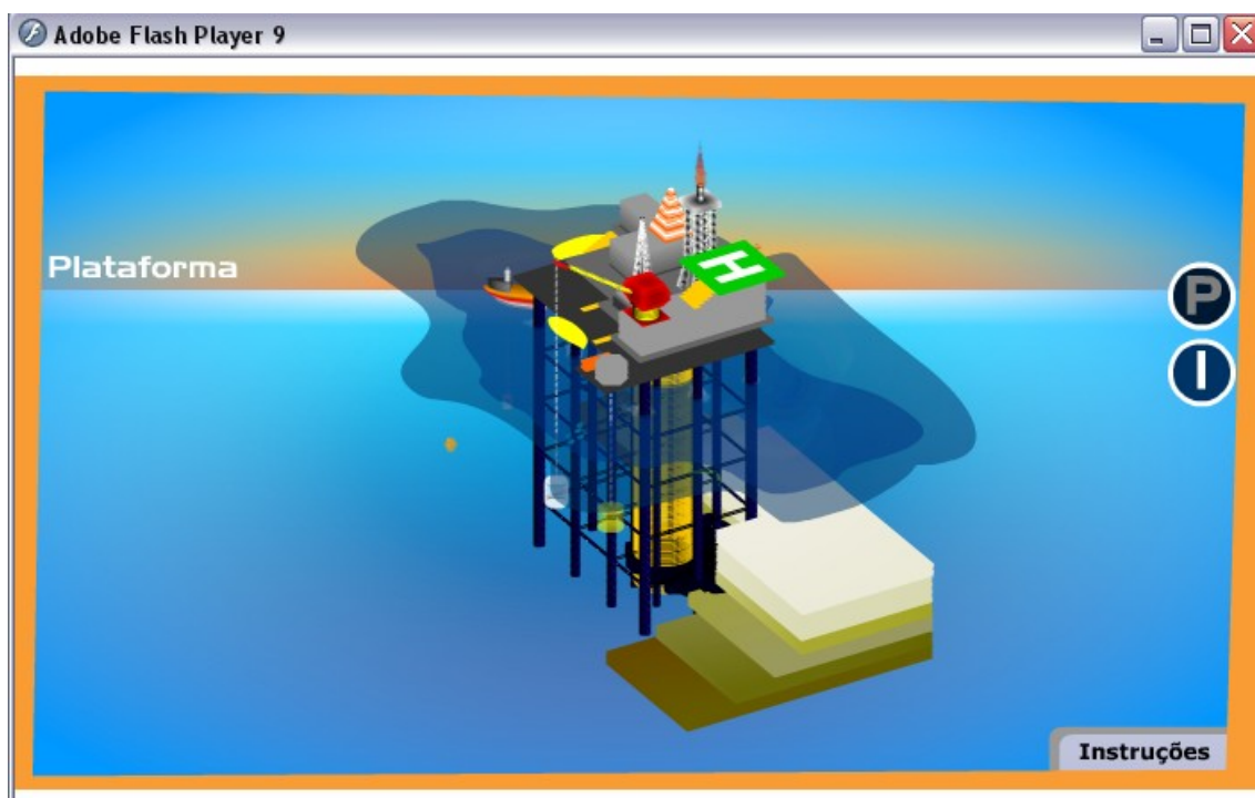
Figura 2: Após o clique no botão “ENTRAR”, surgirá na tela da nossa plataforma virtual. Nela nós encontramos no lado direito na lateral dois botões que permitem a escolha de qual ambiente o usuário pretende observar (“P” de plataforma e “I” de ilha onde se encontra a refinaria).